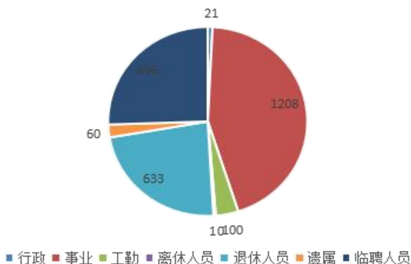
部门人员实有情况说明

截止 2018 年底，本部门人员编制 1270 人，其中行政编制 21 人、事业编制 1201 人、工勤编制 48 人；实有人员 1329 人，其中行政 21 人、事业 1208 人、工勤 100 人。单位管理的离退休人员 643 人，其中离休 10 人、退休 633 人（移交养老经办中心）；遗属人数 60 人，其中：60 年代精简 4 人。临时聘用 696 人，其中：经编制部门批准的聘用的临时人员 370 人。